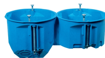
Połączone puszki PV60K i PV60D za pomocą łącznika KD71