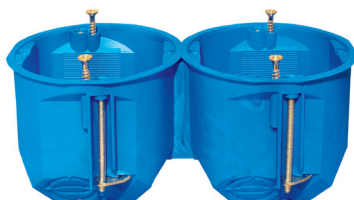
Połączone ze sobą puszki PV60D